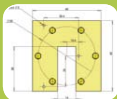
Étude et conception

SOLTYS est spécialiste de l'énergie solaire et de l'éclairage. Lauréat du concours «Entreprise innovante et Développement durable», SOLTYS conçoit et fabrique des équipements solaires simples, performants et économiques pour le plus grand nombre.