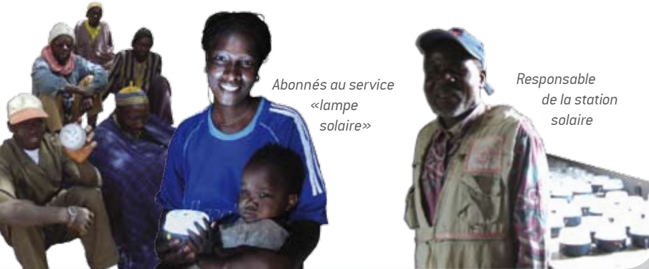
Abonnés au service «lampe solaire»

Pour un quartier ou un village. Ces kits solaires peuvent recharger plusieurs dizaines ou centaines de lampes ELIXO à la fois, ainsi que des téléphones portables. Ils permettent de constituer une station solaire villageoise à laquelle les habitants s'abonnent pour recevoir une lampe ELIXO, qui éclaire mieux et revient moins cher qu'une lampe à pétrole.