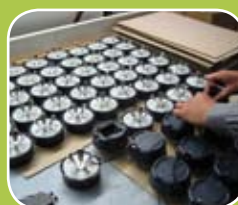
Fabrication et assemblage