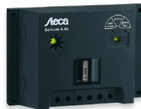
Régulateur 6A 12V 13x9x4cm 165g