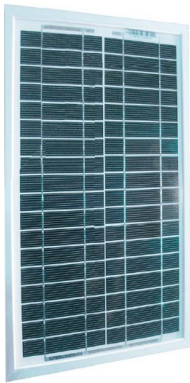
Panneau solaire 15W 12V 45x30x3,5cm 2kg

Les kits solaires LED sont destinés à l'éclairage et à la recharge des téléphones portables en sites isolés. Très simples à installer, ils procurent le confort électrique nécessaire au quotidien. Ils se composent d'un panneau solaire, un régulateur, 2 à 3 ampoules LED 3W et une prise allume-cigare 12V pour la charge des téléphones portables.