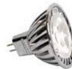
Ampoule LED 3W 12V 300 lumen